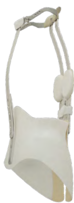
Acima, um técnico finaliza detalhes de um colete Milwaukee. Ao lado, o colete pronto.

ÓRTESES São dispositivos que auxiliam nas funções ou previnem o aumento de deformidades.