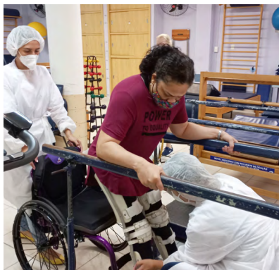
Acima, tratamentos no Setor de Reabilitação Neurológica da ABBR.