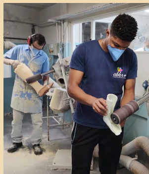
Área de acabamento.

A Oficina Ortopédica possui uma equipe especializada composta por médicos fisiatras, ortesistas, protesistas, sapateiros, fisioterapeutas e terapeutas ocupacionais.