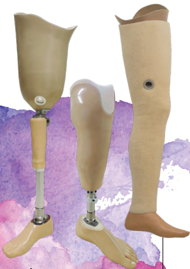
PRÓTESES DE MEMBRO INFERIOR

Próteses são dispositivos utilizados para substituir membros amputados ou mal formados.