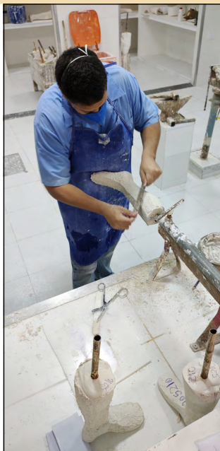
Acima, um técnico no Setor de Gesso preparando o molde para uma órtese.