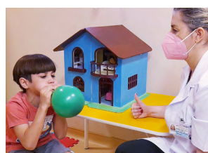
Setor de Fonoaudiologia.

Fonoaudiologia Psicologia Serviço Social Consultórios Médicos Enfermagem