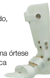
À direita, uma órtese suropodálica finalizada.