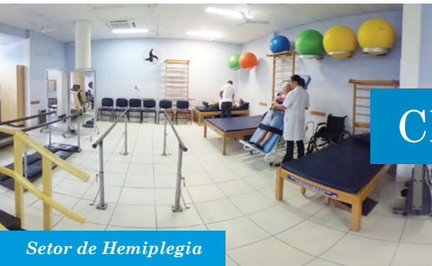
Setor de Hemiplegia

A ABBR É FORMADA POR UM CENTRO DE REABILITAÇÃO E UMA OFICINA ORTOPÉDICA