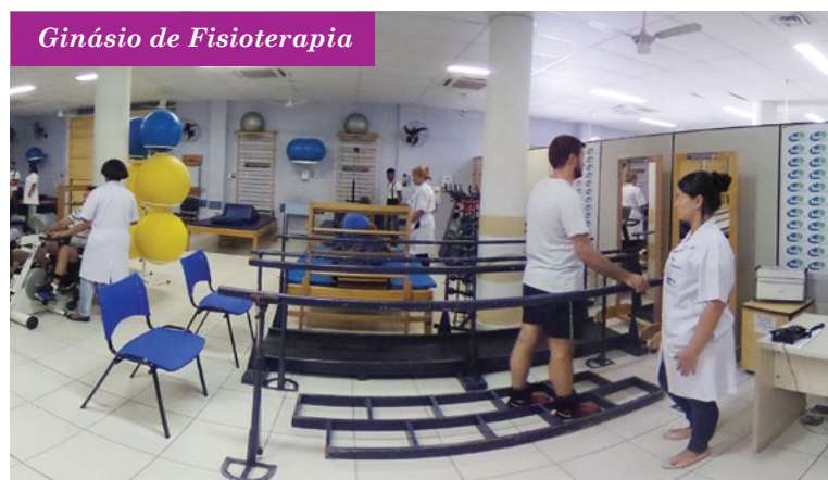
Ginásio de Fisioterapia

A nossa EQUIPE MULTIDISCIPLINAR trabalha com uma abordagem terapêutica ampla, focada nas necessidades de cada paciente e conta com: médicos fisiatras, médicos neurologistas, fisioterapeutas, terapeutas ocupacionais, psicólogos, assistentes sociais, fonoaudiólogos, musicoterapeutas, pedagogos e enfermeiras.